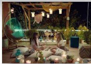
Casa da Eda

Café da manhã no hotel. Saída com guia para visitar os cenários das novelas turcas. Café da manhã no haras (casa de Bolat, em Beykoz). Floricultura de Eda (Uskudar), Palácio Beyberleyr, Torre da Donzela, atravessar a ponte ( Üsküdar, Kuzguncuk, Kandilli, etc.