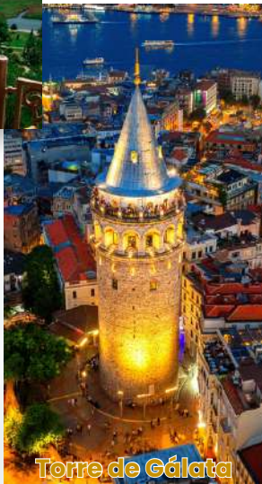
Torre de Gálata