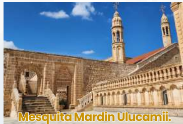
Mesquita Mardin Ulucamii.