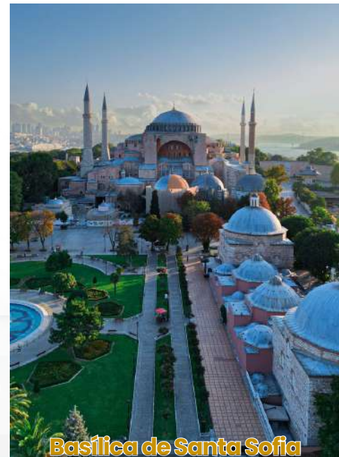
Basílica de Santa Sofia

Café da manhã no hotel. Translado para o aeroporto.