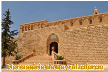
Monastério de Deyrulzafaran