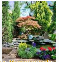
Jardim Botânico Kuzguncuk