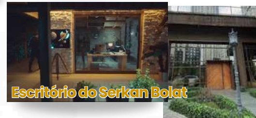
Escritório do Serkan Bolat