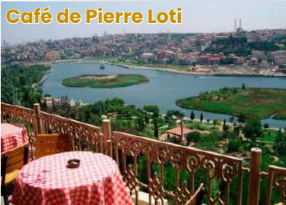
Café de Pierre Loti

Café da manhã no hotel, saída para o Morro do Café de Pierre Loti, local preferido dos célebre escritor francês Pierre Los, de onde eles poderão contemplar a bela vista do Chifre de Ouro. Visitamos também o Bazar Egípcio, a 2ª maior e mais antigo bazar de Istanbul, para comprar especiarias, frutas secas, doces, chá e caviar. Almoço em um restaurante local. Mais tarde Faremos um cruzeiro no Bósforo. O navio de cruzeiro viaja em balsas regulares e navega no Bósforo, que separa a Ásia da Europa. Teremos oportunidades para fotografar as belezas naturais da região e os palácios do período otomano que são até hoje nas margens do Bósforo. Também veremos a praça e os cafés de Ortaköy, o Mesquita Mecidiye e as pontes suspensas que conectar os dois continentes, então continuaremos para Beyoğlu usando o túnel, um trem subterrâneo de Istanbul. Tem apenas 573 metros distância entre suas duas estações, Karaköy e o Rua Istiklal, inaugurada em 17 de janeiro, 1875, e o Túnel é uma das 4 linhas de mais antiga ferrovia subterrânea do mundo. Apenas o metrô de Londres (1863), o New York (1868) e o funicular de Lyon (1862) são mais antigo. Hoje, é o sistema de transporte menor metrô do mundo com apenas dois temporadas. Em Beyoğlu visitaremos a Torre Galata, que fica ao norte do Chifre de Ouro e é um dos lugares mais atraentes da cidade, com seus 650 anos, 67 metros e vista.