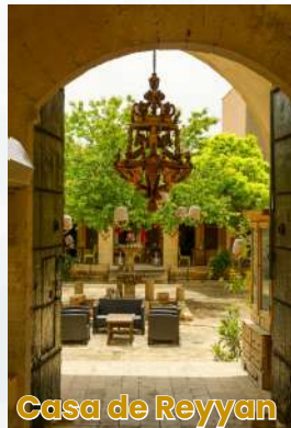
Casa de Reyyan